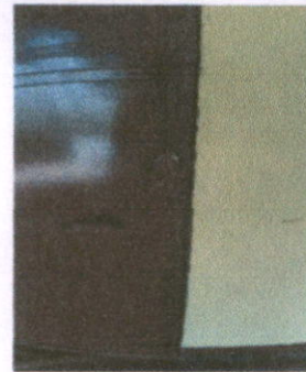
Foto 4: mantenimiento a puertas del establecimiento (sustrucción de chapas y pintura)