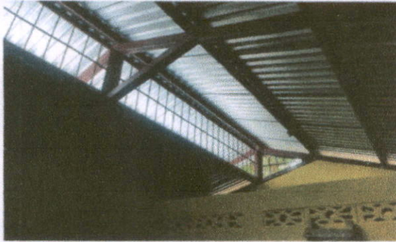
Foto 1: Sustrucción de lamina, por lamina troquelada aluzinc en modulo 1